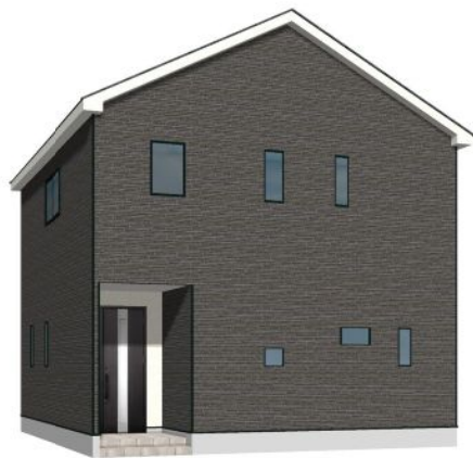
※建具等の仕様は変更になる可能性があります