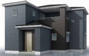
東区多々良第十 1号棟

住宅性能評価が証明する品質の高さ、景観としての魅力ある外観デザインやクオリティとコストのバランスまで考えた快適なお住まいをお届けいたします♪オプション工事で駐車3台可能♪お部屋からの眺望は開放的です♪